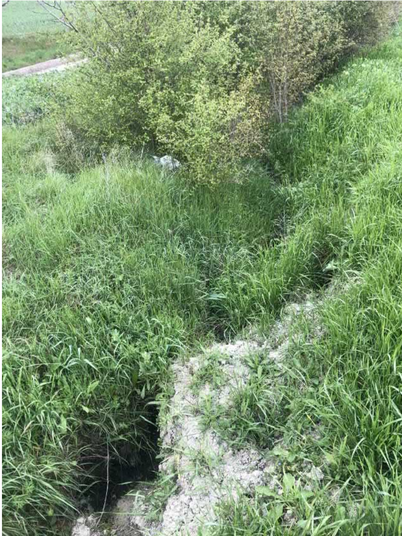
Deflusso lungo la scolina naturale