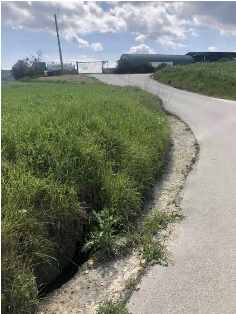
Deflusso nella scolina della strada comunale con ingresso nel sottopasso della strada comunale