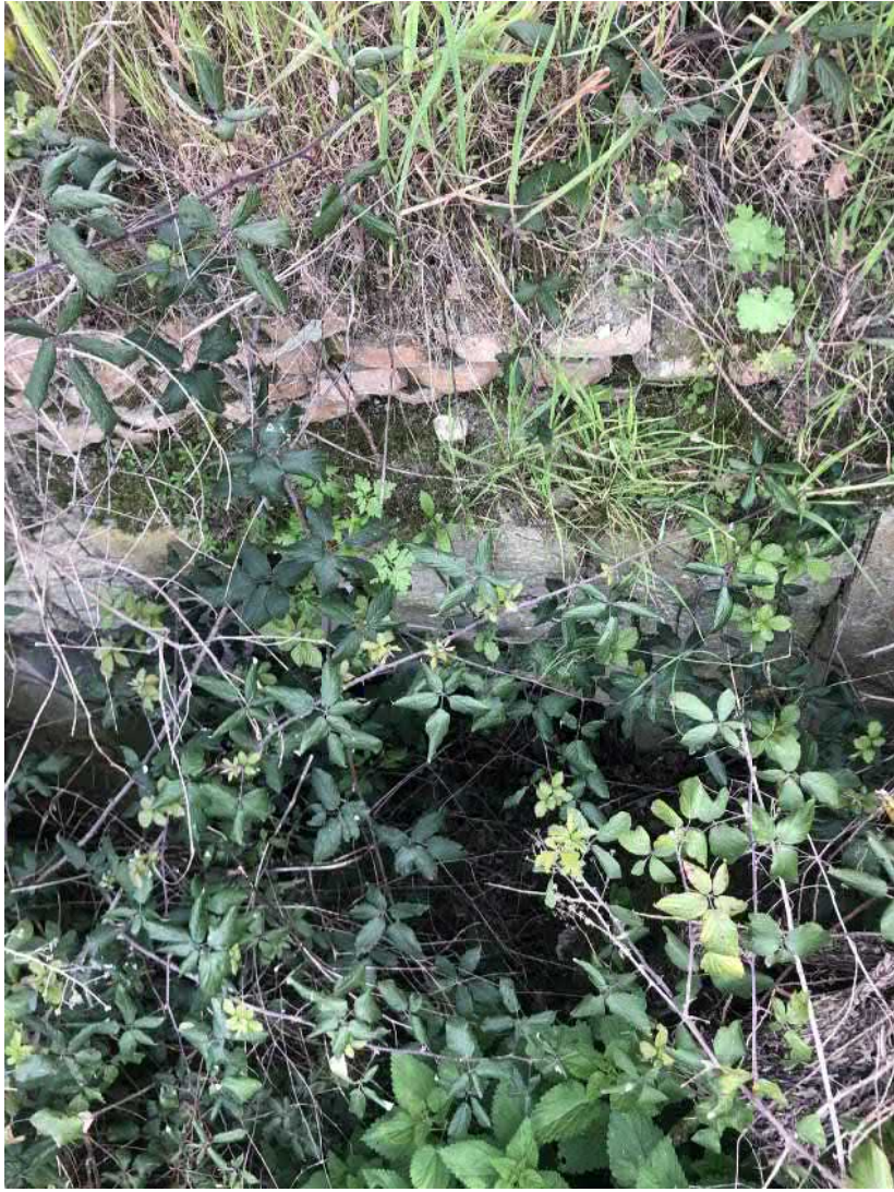
Uscita dopo l'attraversamento della strada comunale