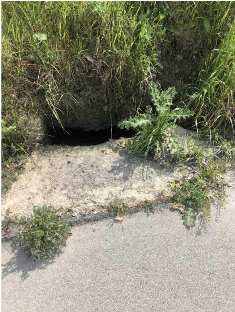
Ingresso del sottopasso della strada comunale