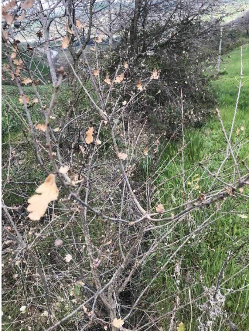
Deflusso lungo la scolina naturale