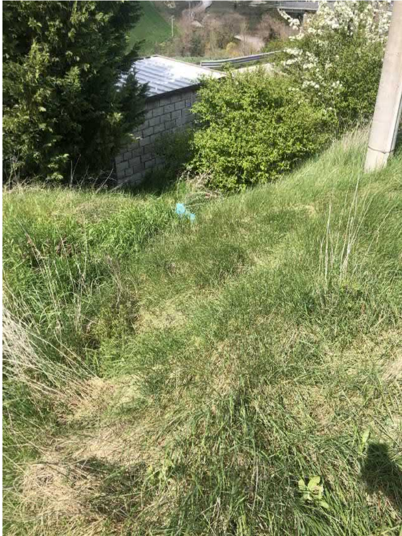
Deflusso lungo la scolina naturale